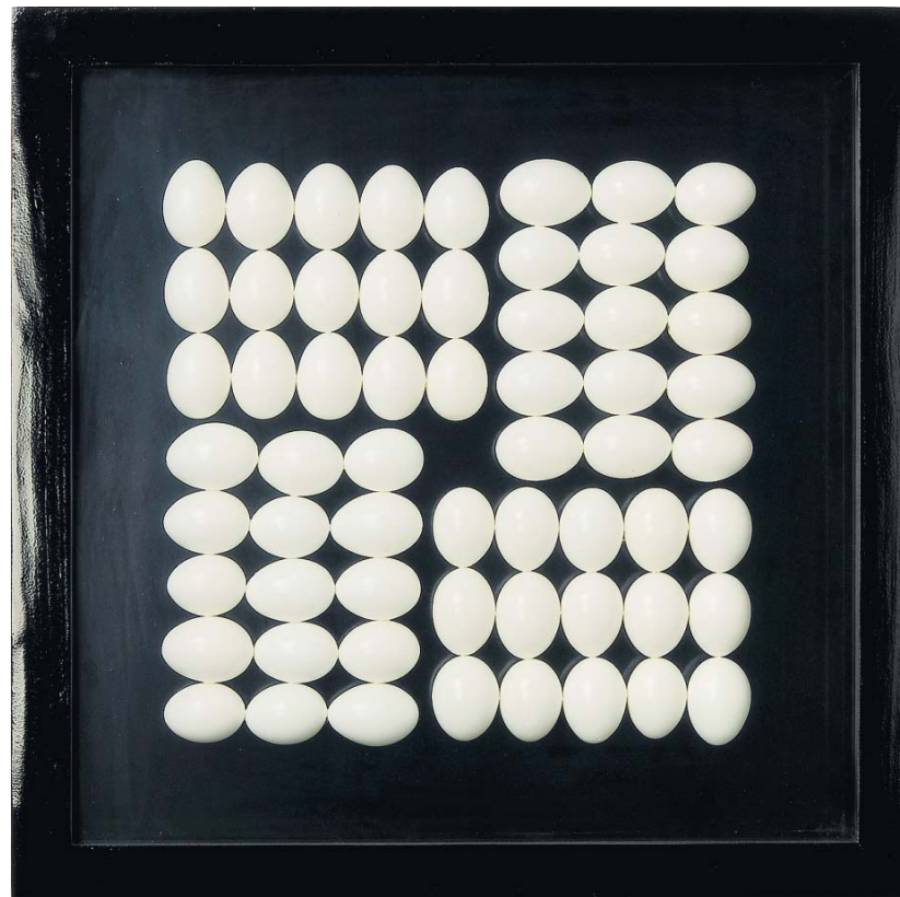
Werk van Koos van der Sloot. Links: R-A. Boven: Het eeuwige ja (60 min.) Onder links: Lân fan tachtich . Onder rechts: Zandlopers . Rechts: VE14 (virtual eggs) op twee manieren gefotografeerd.

Na het Natuurmuseum in Leeuwarden (2009) volgde de tentoon-